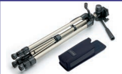
Stativadapter, Stativ, Kalibrierzertifikat, Gürteltasche.